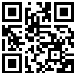
QR Code สมัคร

ผู้อำนวยการวิทยาลัยการอาชีพนครศรีธรรมราช